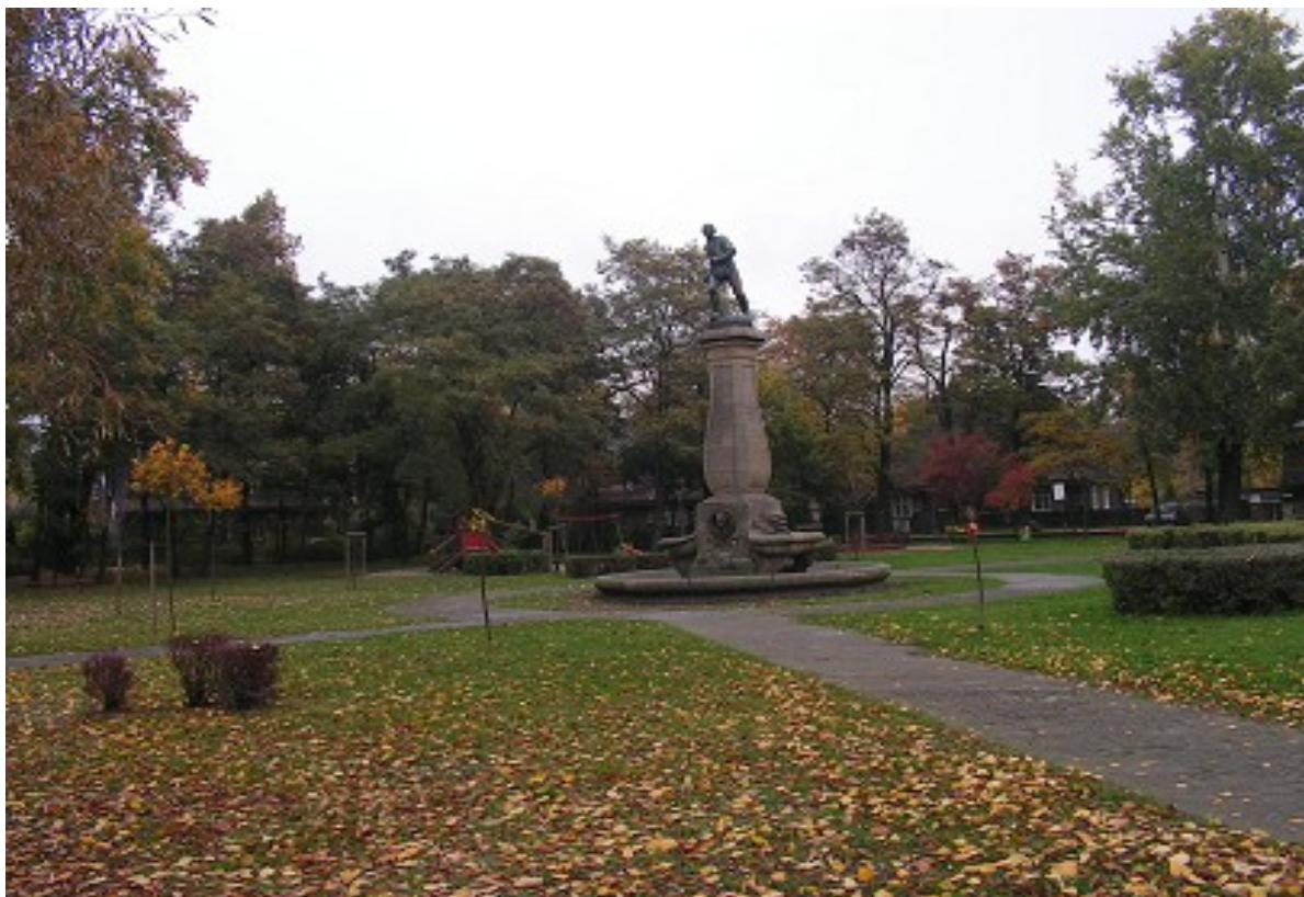
Fot. 1 Pomnik „Siewcy”, rzeźb. Marcin Rożek, ul. Armii Poznań