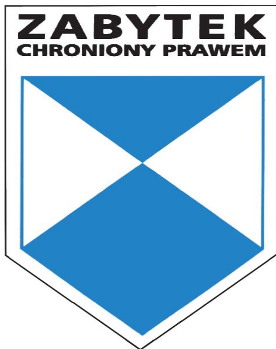
rys. 1 Znak informacyjny tzw. „Błękitna tarcza”

W 2014 roku Urząd Miasta Luboń wystąpił z wnioskiem do Powiatowego Konserwatora Zabytków w Poznaniu o zgodę na zamieszczenie na zabytkach nieruchomych wpisanych do rejestru zabytków znaku informującego o tym, iż zabytek podlega ochronie (zgodnie z art. 12 Ustawy z dnia 23 lipca 2003 o ochronie zabytków i opiece nad zabytkami (Dz. U. Nr 162 poz. 1568 ze zmianami). Zgodnie z Rozporządzeniem Rady Ministrów z dnia 9 lutego 2004 r. (Dz.U. Nr 30, 259) w sprawie wzoru znaku informacyjnego umieszczonego na zabytkach nieruchomych wpisanych do rejestru zabytków znak ten ma kształt pięciokątnej tarczy skierowanej ostrzem w dół, o wymiarach 185 x 100 mm, wykonanej z blachy, na białym tle w górnej części napis: „ZABYTEK CHRONIONY PRAWEM”, poniżej tarcza herbowa złożona z błękitnego kwadratu, którego jeden z kątów tworzy ostrze tarczy oraz umieszczonego nad nim błękitnego trójkąta, rozgraniczonych po każdej stronie białym trójkątem (rys.1).