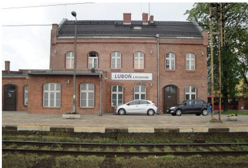
Fot. 2 Dworzec PKP, ul. Dworcowa

Luboń – miasto w centrum Wielkopolski www.lubon.pl