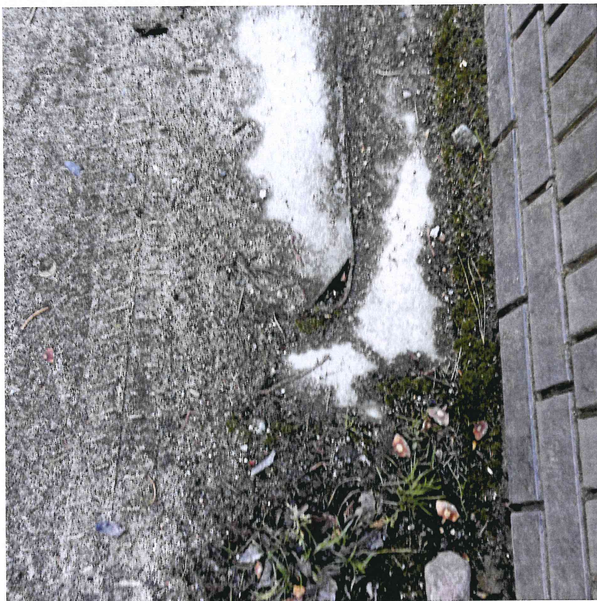
Fot. 2. Ślady kół bezpośrednio pod płotem przy ul. Jana Panka